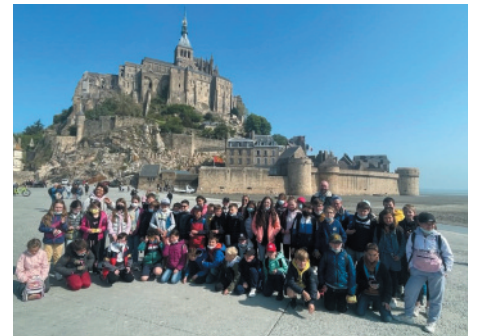
Voyage scolaire en Normandie