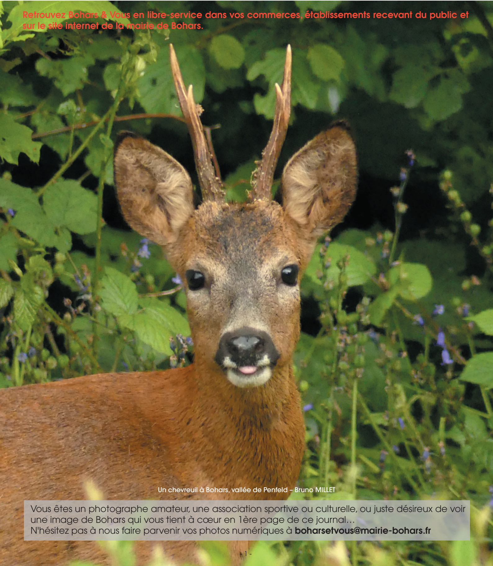
Un chevreuil à Bohars, vallée de Penfeld - Bruno MILLET

Retrouvez Bohars & Vous en libre-service dans vos commerces, établissements recevant du public et sur le site internet de la mairie de Bohars.