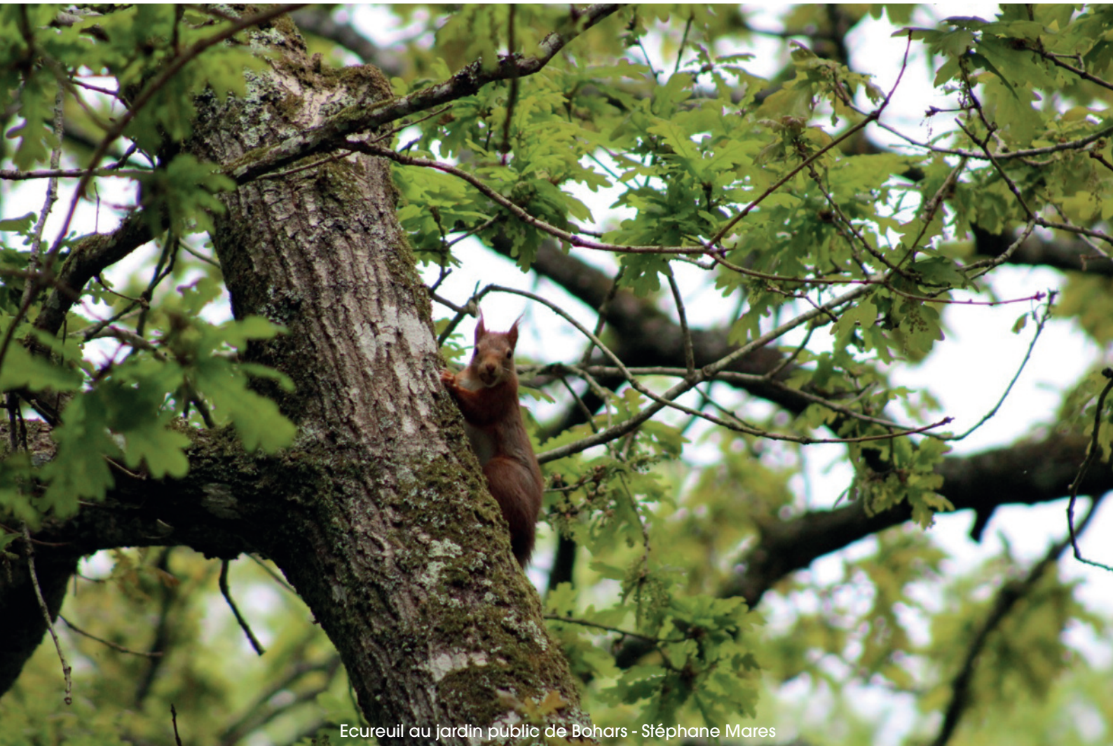
Ecureuil au jardin public de Bohars - Stéphane Mares

Retrouvez Bohars & Vous en libre-service dans vos commerces, établissements recevant du public et sur le site internet de la mairie de Bohars.