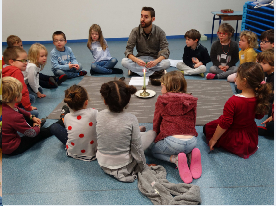
École Notre Dame de Lourdes p 8