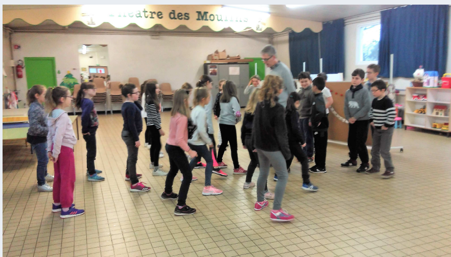
École Notre Dame de Lourdes p 5