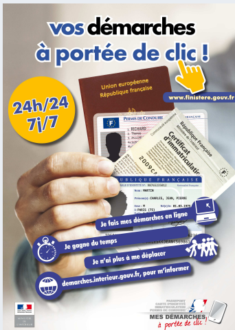
Service en ligne p 4