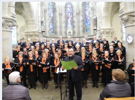
Téléthon p 8