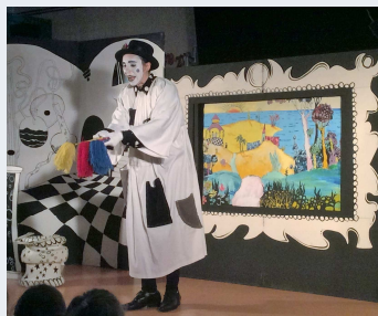
École publique p 5