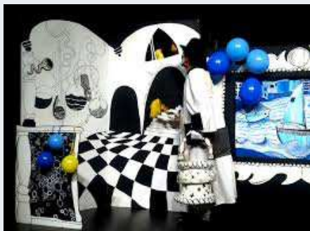
École publique p 5