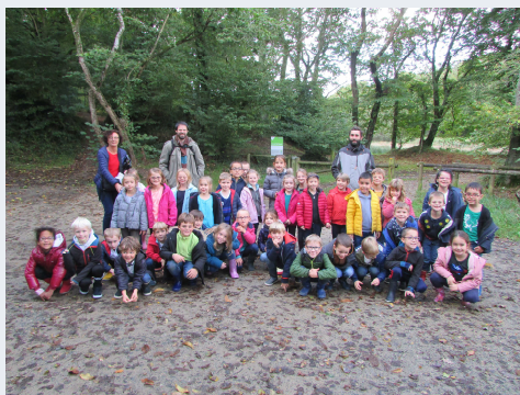
Ecole Notre Dame de Lourdes p 5