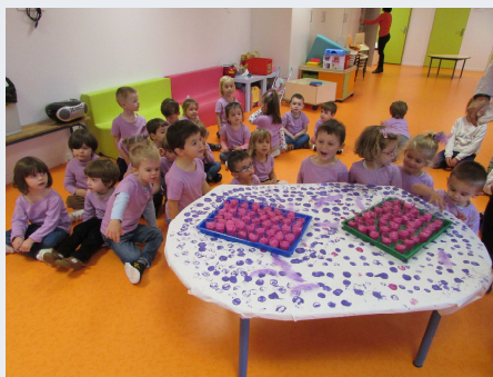
Ecole Notre Dame de Lourdes p 5