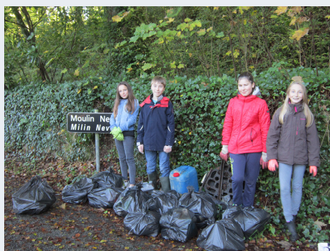
Animation Jeunesse p 8