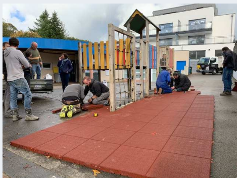
Ecole Notre Dame de Lourdes p 5