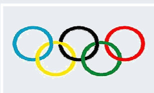
Informations jeunesse p 9 et 10