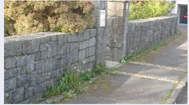
Désherber chez soi et devant soi p 4