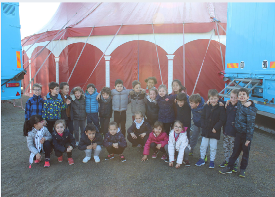
École Notre Dame de Lourdes p 8