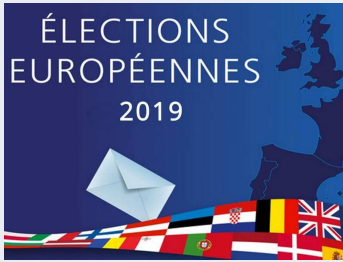
Communication mairie p 3