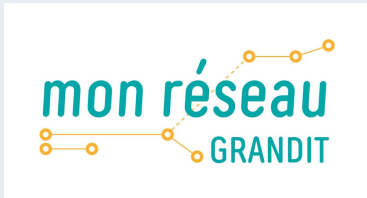
Communication Brest métropole p 5