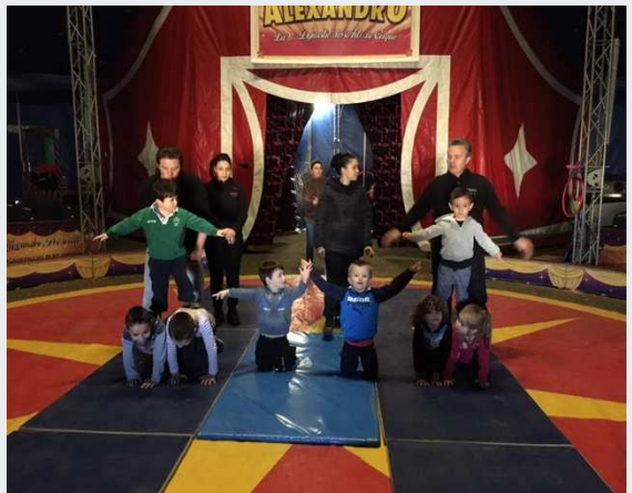
École Notre Dame de Lourdes p 8